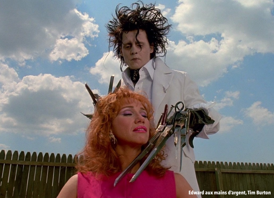
Edward aux mains d'argent, Tim Burton